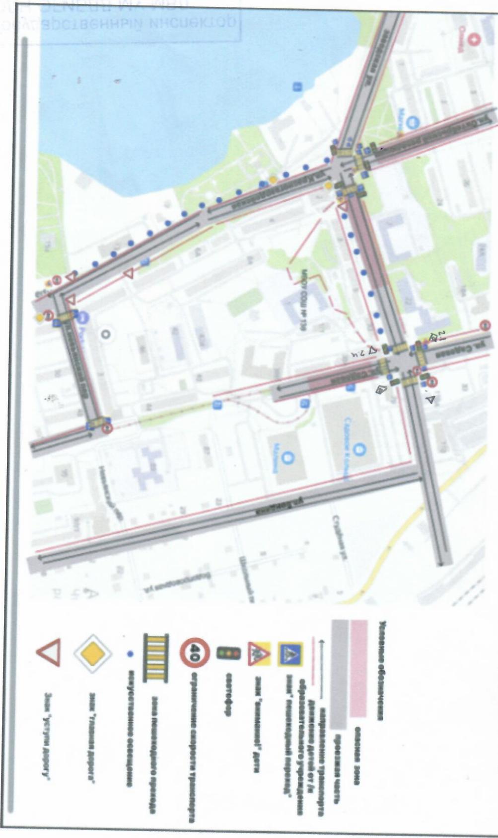
План - схема образовательной организации Район расположения МБОУ СОШ №138, пути движения транспортных средств и Детей (обучающихся)

ГОСУДАРСТВЕННОЕ ОБРАЗОВАТЕЛЬНОЕ УЧРЕЖДЕНИЕ МОСКОВСКОЙ ОБЛАСТИ ОБЩЕОБРАЗОВАТЕЛЬНАЯ ШКОЛА №138